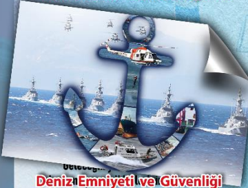
Deniz Emniyeti ve Güvenliği Tezli Yüksek Lisans Programı ve becerilere sahip olması ve