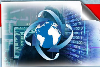
Güvenlik Yönetimi (İstihbarat) Tezli Yüksek Lisans Programı