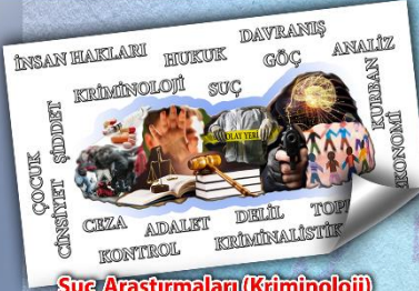
Suç Araştırmaları (Kriminoloji) Tezli Yüksek Lisans Programı