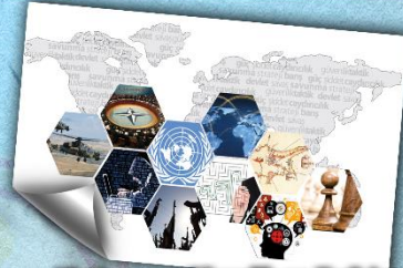
Uluslararası Güvenlik ve Terörizm Tezli Yüksek Lisans Programı