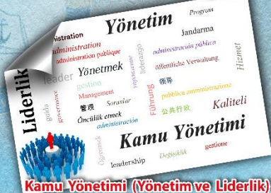
Kamu Yönetimi (Yönetim ve Liderlik) Tezli Yüksek Lisans Programı