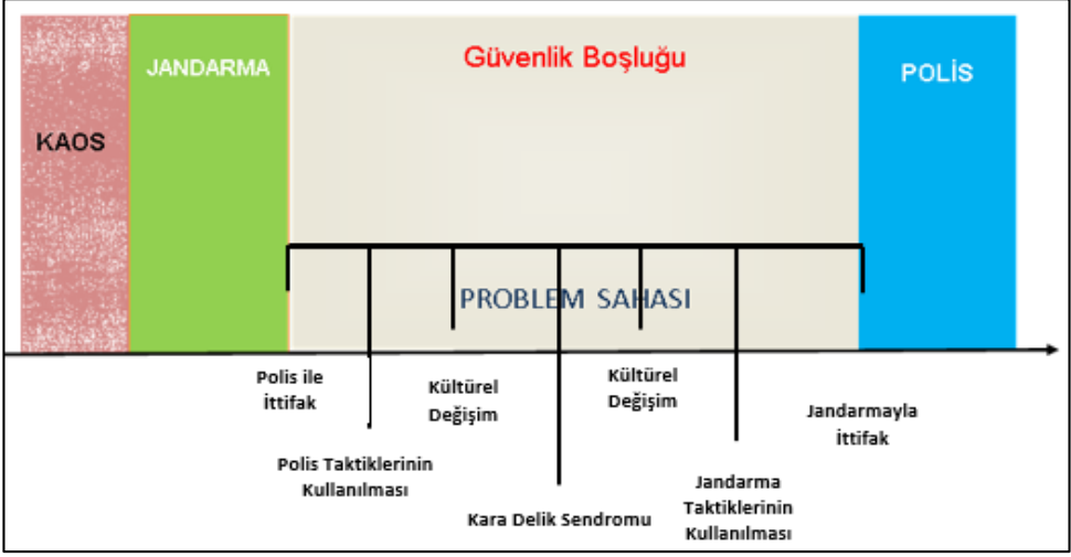
Şekil-2. Kolluk Yakınsama Süreci